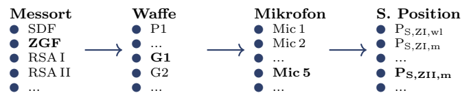
Abbildung 3: Skizze einer exemplarischen Anfrage

Im Folgenden wird an einem Beispiel das Erstellen einer Anfrage sowie deren Bearbeitungsdauer detaillierter untersucht. Hierzu ist in Abbildung 3 der Ausschnitt einer Anfrage an die Datenbank schematisch abgebildet.